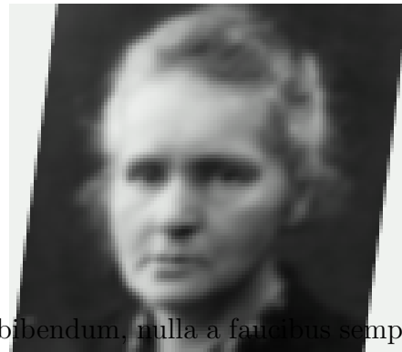
Figure 2: An example of figure wrapped in text.

Fusce mauris. Vestibulum luctus nibh at lectus. Sed bibendum, nulla a faucibus semper, leo velit ultricies tellus, ac venenatis arcu wisi vel nisl. Vestibulum diam. Aliquam pellentesque, augue quis sagittis