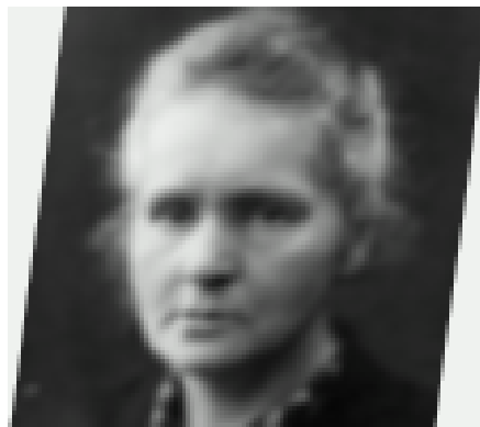
Figure 2: An example of figure wrapped in text.

Fusce mauris. Vestibulum luctus nibh at lectus. Sed bibendum, nulla a faucibus semper, leo velit ultricies tellus, ac venenatis arcu wisi vel nisl. Vestibulum diam. Aliquam pellen-